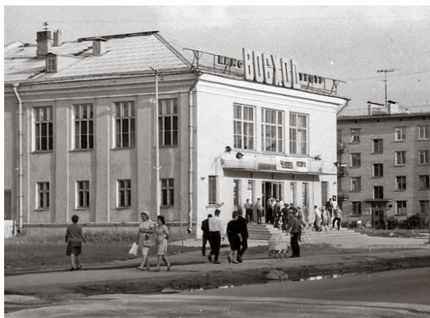
Кинотеатр «Восход», 1960-е

В послевоенные годы юго-западные окраины Ленинграда буквально поднимались из руин.