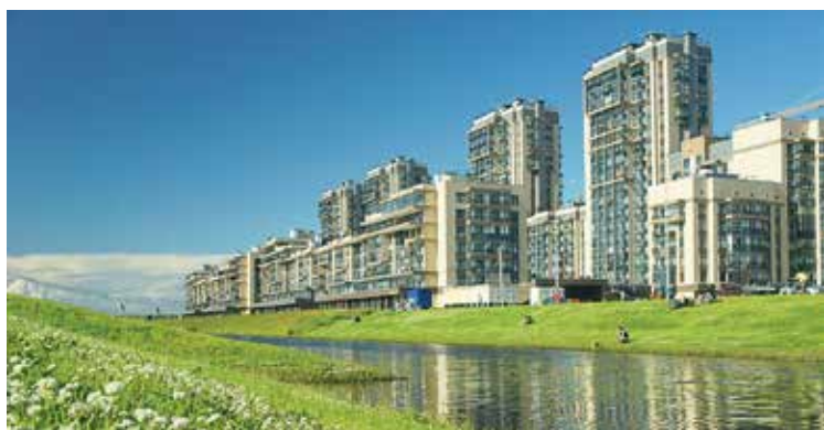
Красносельский район сегодня