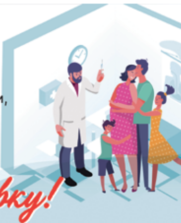
График вакцинации против гриппа Выездные прививочные бригады работают в МО УРИЦК

17 октября с 10:00 до 14:00 21 октября с 14:00 до 19:00 28 октября с 14:00 до 19:00 по адресу: ул. Партизана Германа, 2, ТК «О'КЕЙ»