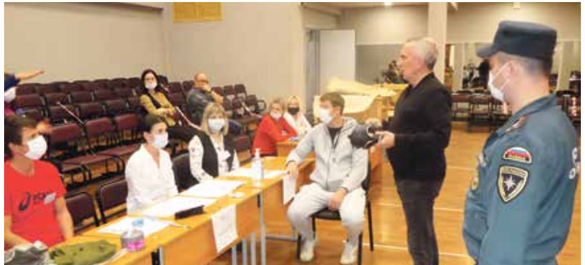
Пункт выдачи СИЗ на базе гимназии №399

На территории нашего округа на базе гимназии № 399 был развернут пункт выдачи средств индивидуальной защиты. В лицее № 369 проводили учебную эвакуацию детей из зоны возможного заражения химически опасными веществами в