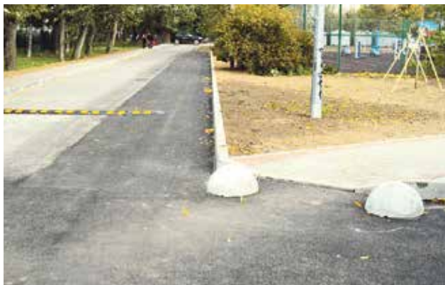
Проезд и пешеходная дорожка у школы №383 после комплексного благоустройства

По данному адресу Местная администрация МО УРИЦК выполнила комплексное благоустройство: уширение проезда с установкой высокого бордюрного камня, исключающего парковку автомобилей на газоне, ремонт асфальта и установка полусфер. Обустроены новые пешеходные дорожки и посажены деревья.