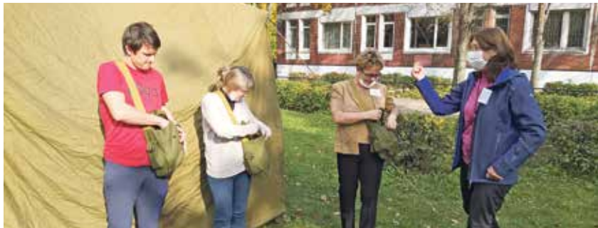
Подготовка к технической проверке противогозагов, гимназия №399

2 октября на всей территории Санкт-Петербурга зазвучали уличные сирены и громкоговорители. Была проведена комплексная техническая проверка городской системы оповещения населения. Для передачи сигналов оповещения были задействованы и каналы телевизионных, радиовещательных станций, технические средства оповещения организаций района.