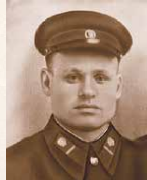
БЫКОВСКИЙ Владимир Ефимович морьяк Северного ВМФ 1924–2013 гг.