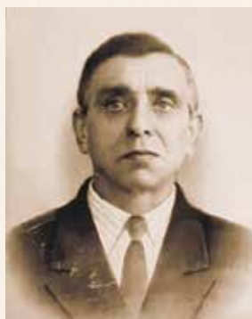
ДМИТРИЕВ Михаил Феоктистович партизан 1899–1976 гг.