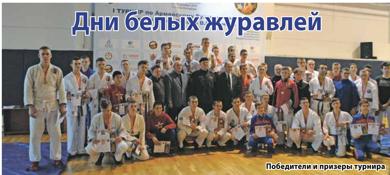
Победители и призеры турнира

С портсмены-рукопашники УРИЦКА достойно выступили на одноименной VIII ежегодной акции памяти павших воинов России.