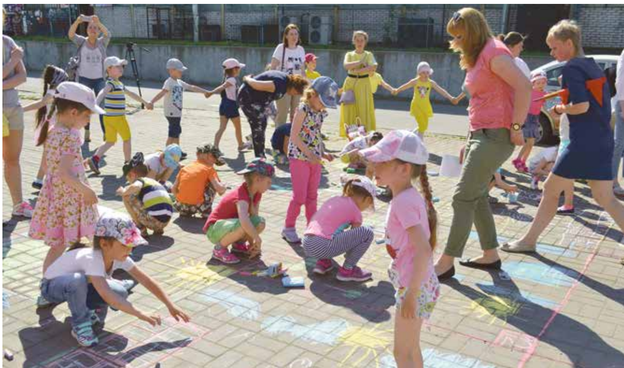
Конкурс рисунков на асфальте

П ровести свободное время интересно в нашем округе могут все желающие. В 2018 году финансирование на реализацию программ по организации и проведению праздничных и досуговых мероприятий составило 7191,4 тыс. руб. В течение года проведено 126 мероприятий, в которых приняли участие около 23 000 жителей.