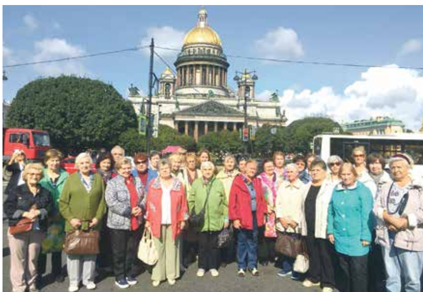
Обзорная экскурсия по Санкт-Петербургу