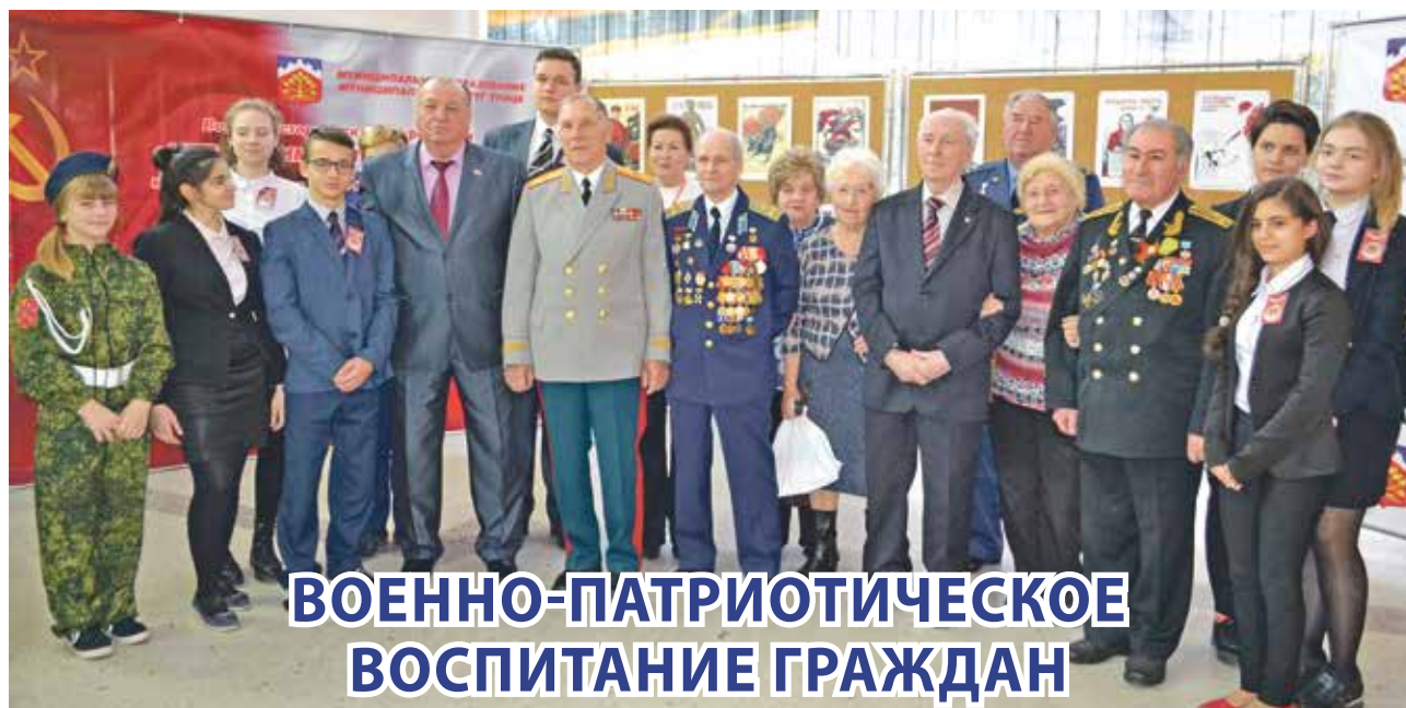
Конференция, посвященная 100-летию создания Красной армии

Д остойное место отведено в нашем округе военно-патриотическому воспитанию. В 2018 году реализация программы проводилась без финансирования. В течение года прошло 32 мероприятия, в которых приняли участие около 20 000 человек.