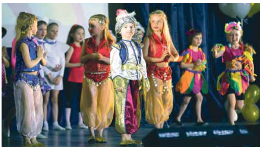
Фестиваль-конкурс «Радуга УРИЦКА»

Под Новый год праздничное мероприятие организовали для взрослых жителей округа, а дети получили билеты на новогодние представления «Золушка» в Большой цирк и на спектакль «Новогодний детектив» в Мюзик-холл.