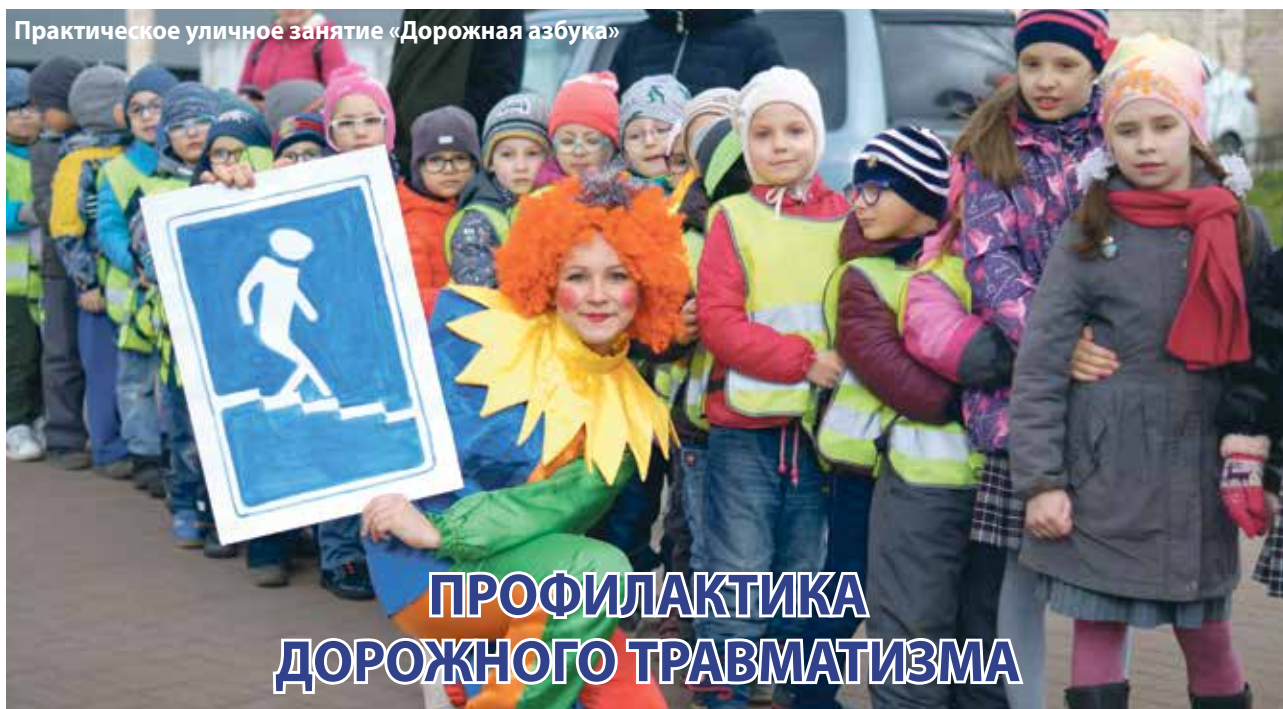
Практическое уличное занятие «Дорожная азбука»

П рофилактика дорожно-го травматизма – одно из важнейших направлений работы Местной администрации. В 2018 году финансирование на реализацию программы по профилактике дорожно-го травматизма составило 352,8 тыс. руб. В мероприятиях приняли участие более 3800 человек.