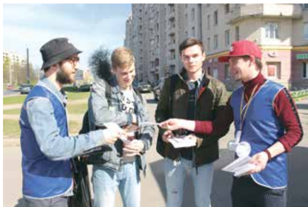
Уличные занятия по профилактике наркомании

Консультативная и тренинговая работа проведена с семьями зависимых от ПАВ.