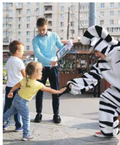
Практическое уличное занятие «Дорога любит порядок»

Организовано три просветительских урока «Береги себя!» с раздачей лифлетов.