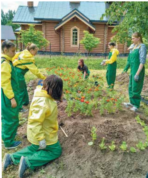
Трудовой отряд УРИЦКА в Полежаевском парке

Местная администрация организовала для трудового отряда автобусную экскурсию в Павловск. Ребята побывали в летней резиденции Павла I.