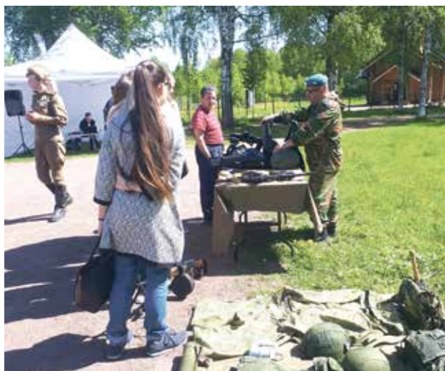
Уличная тренировка по профилактике терроризма и экстремизма «Мы против террора»

Сотрудники Местной администрации принимали участие в совещаниях, конференциях и семинарах по вопросам профилактики терроризма и экстремизма.