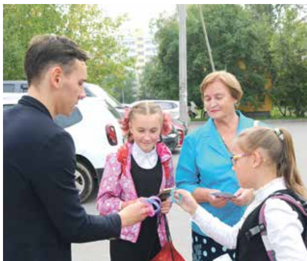
Просветительский урок «Вместе против террора»