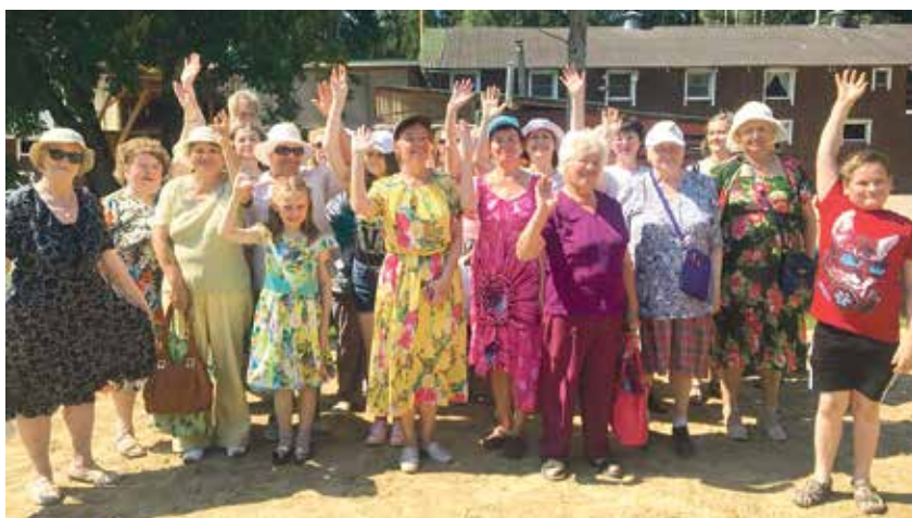
Экскурсия в зубровник