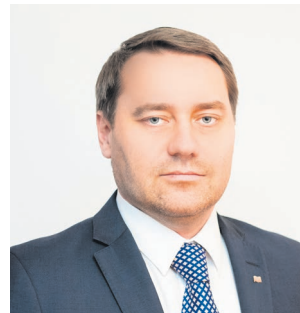
Председатель Законодательного Собрания Санкт-Петербурга Александр Николаевич Бельский