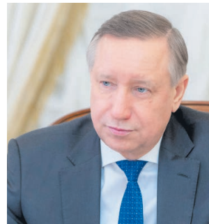
Губернатор Санкт-Петербурга Александр Дмитриевич Беглов

Низкий поклон всем ветеранам! Вечная память павшим за Родину! Мира и добра всем!