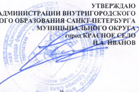
График вызова граждан Красносельского района для прохождения медицинского освидетельствования осенью 2023 года.