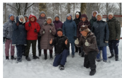
Пенсионеры УРИЦКА, которые занимаются гимнастикой в Полежаевском парке, собрали для бойцов СВО новогодние подарки и шлют им самые искренние поздравления с Новым годом!